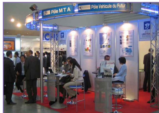
La délégation des pôles automobiles sur le pavillon France au JAEE de Yokohama