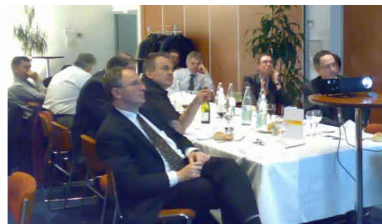
2 ème réunion du Cercle des Entrepreneurs du Pôle

A l'ordre du jour : le bilan 2007, les perspectives 2008, un panorama des tendances du véhicule du futur et des mobilités urbaines et le positionnement du Pôle. Réunion toujours aussi constructive et interactive.