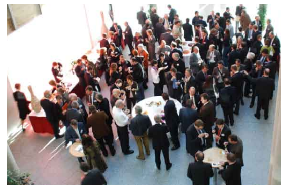
Grand succès pour ce colloque avec plus de 110 participants

Il a traité de la recherche dans le domaine des systèmes d'assistance à la conduite et de la gestion du trafic, et a eu pour objet de dégager des opportunités de coopération franco-allemande en réfléchissant à sa valeur ajoutée dans l'Espace européen de la recherche.