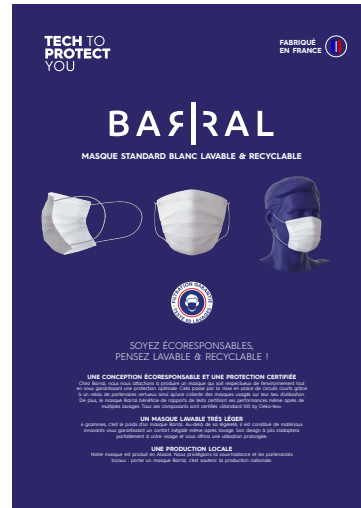
MASQUE ADULTE BLANC