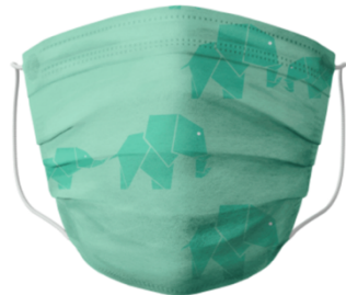
MASQUE ENFANT IMPRIMÉ STANDARD