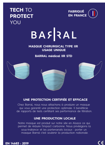
MASQUE CHIRURGICAL BARRAL IIR STD

Filtration > 96% Réglementation (UE)2016/425 5 couches Efficacité de filtration des particules de 3 µm > 99 % Perméabilité à l'air pour une dépression de 100 Pa >117 L.m-2.s-1