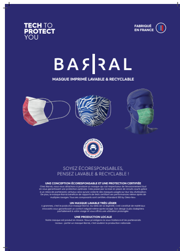
MASQUE ADULTE IMPRIMÉ