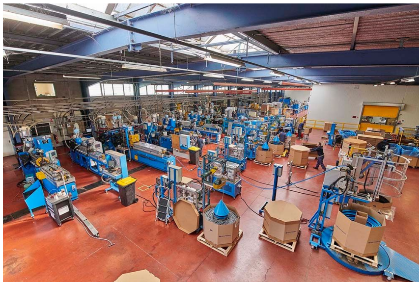
Zone de production Anteuil