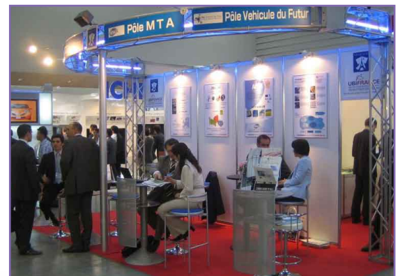
La délégation des pôles automobiles sur le pavillon France au JAEE de Yokohama